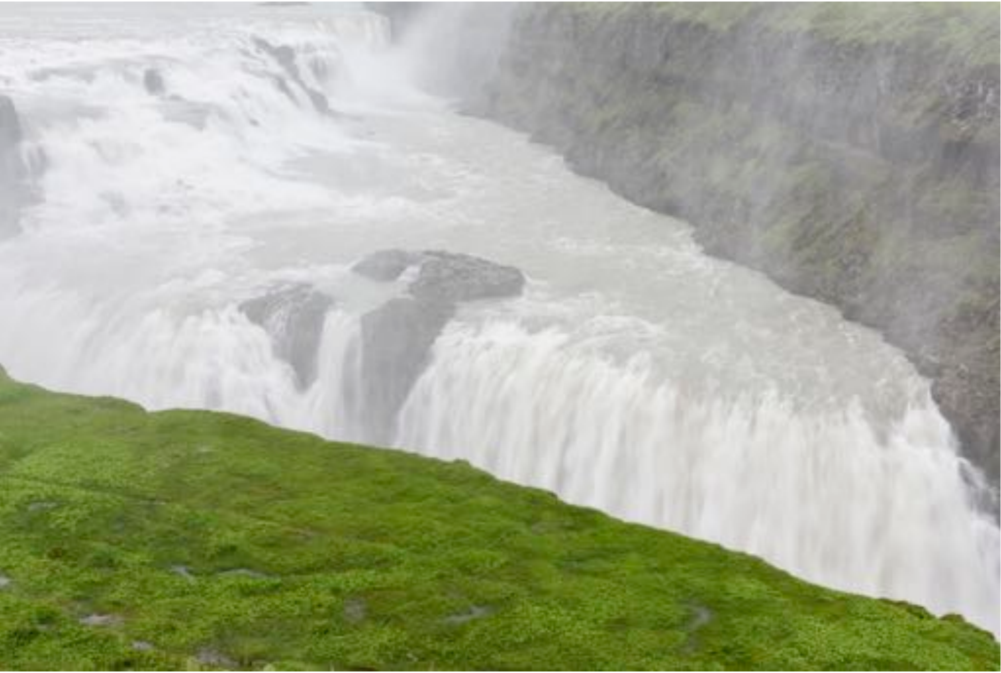
Wonders of nature # 22, 2017