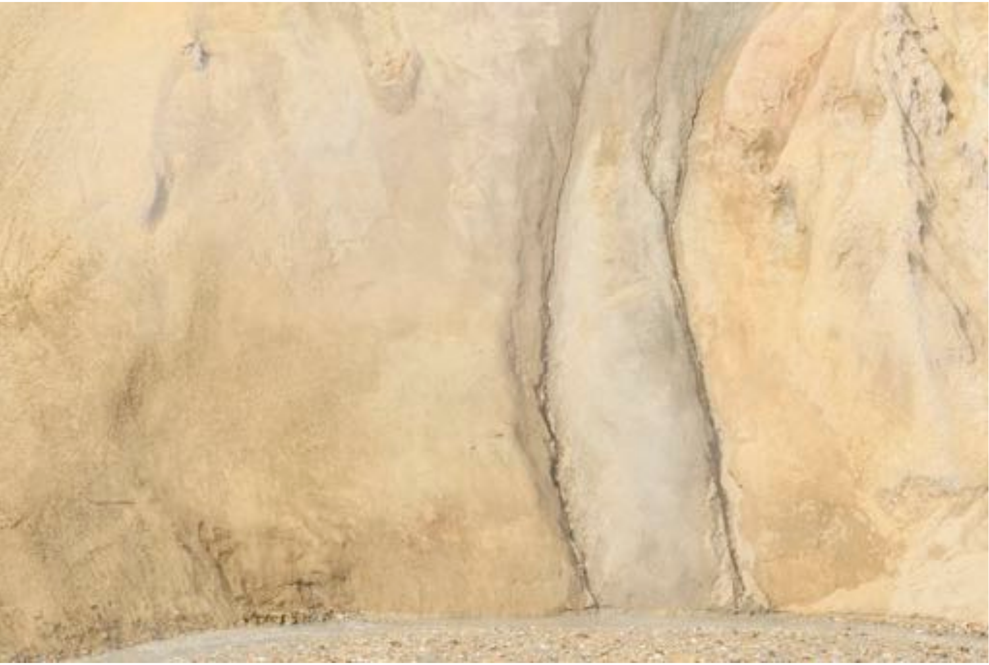
Wonders of nature # 32, 2017