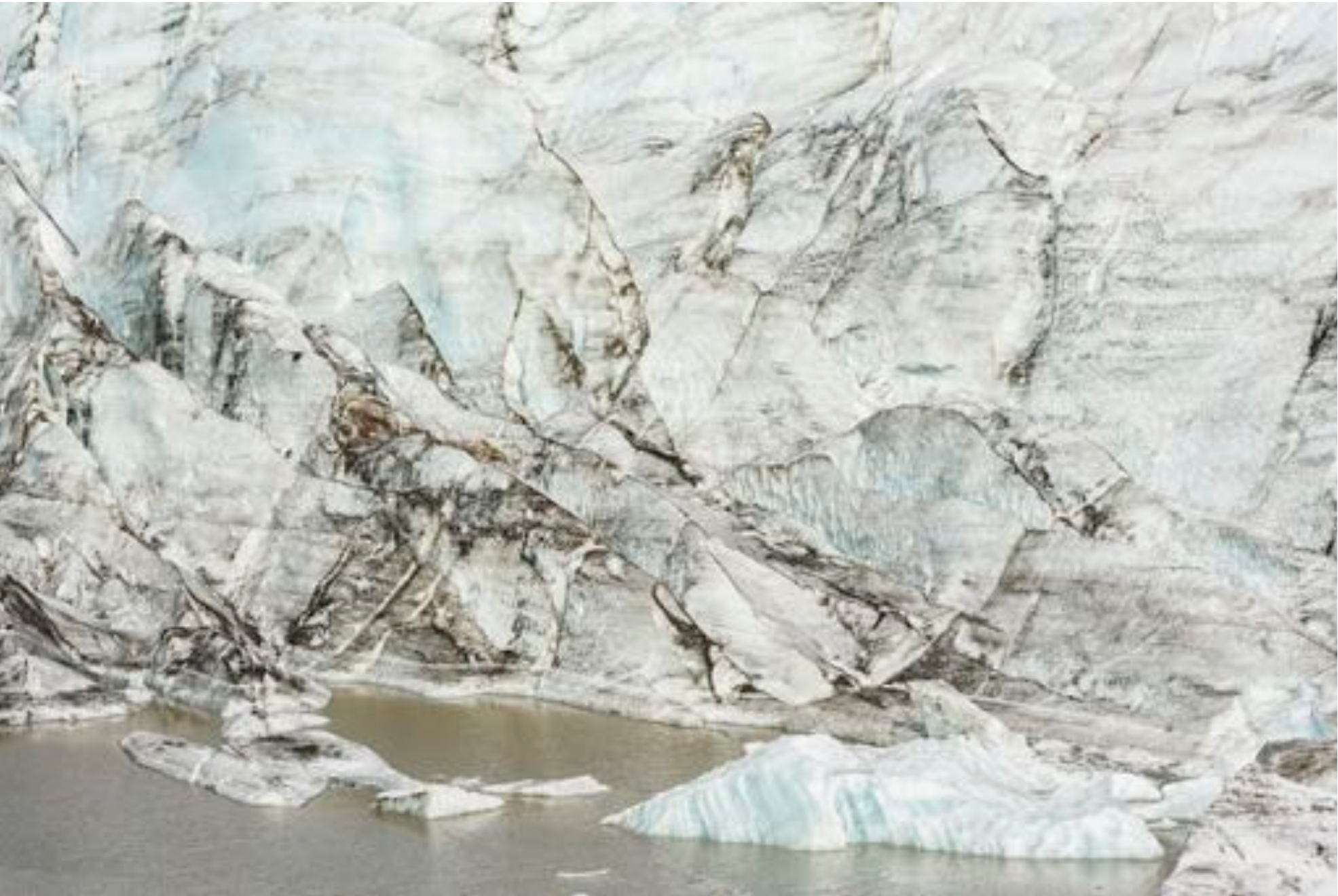
Wonders of nature # 20, (Tip of the tongue), 2017