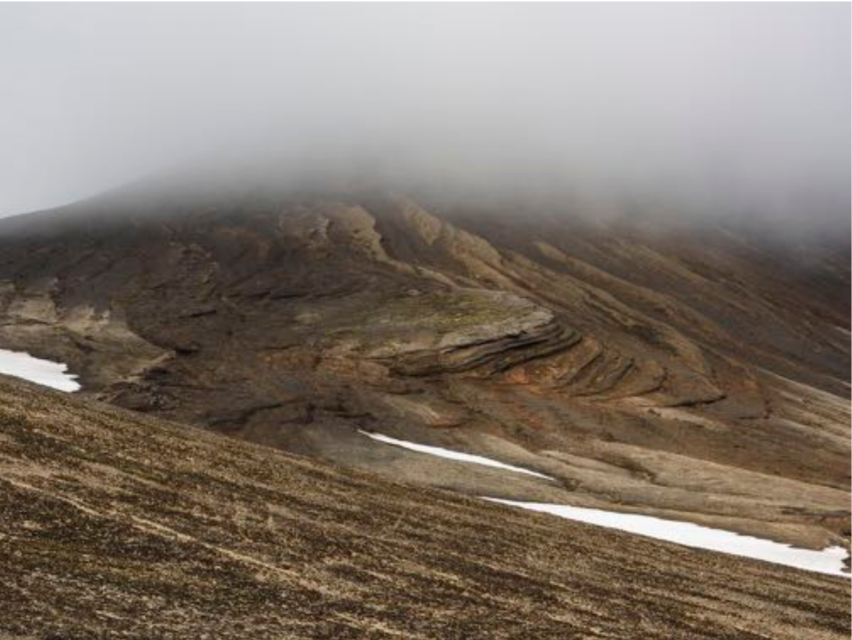
Wonders of nature # 40, 2018