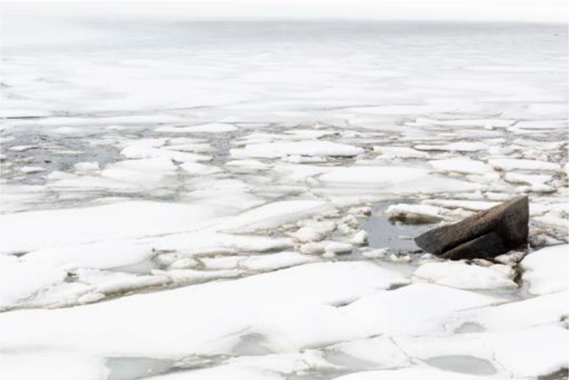
Wonders of nature # 35, (The rock), 2018