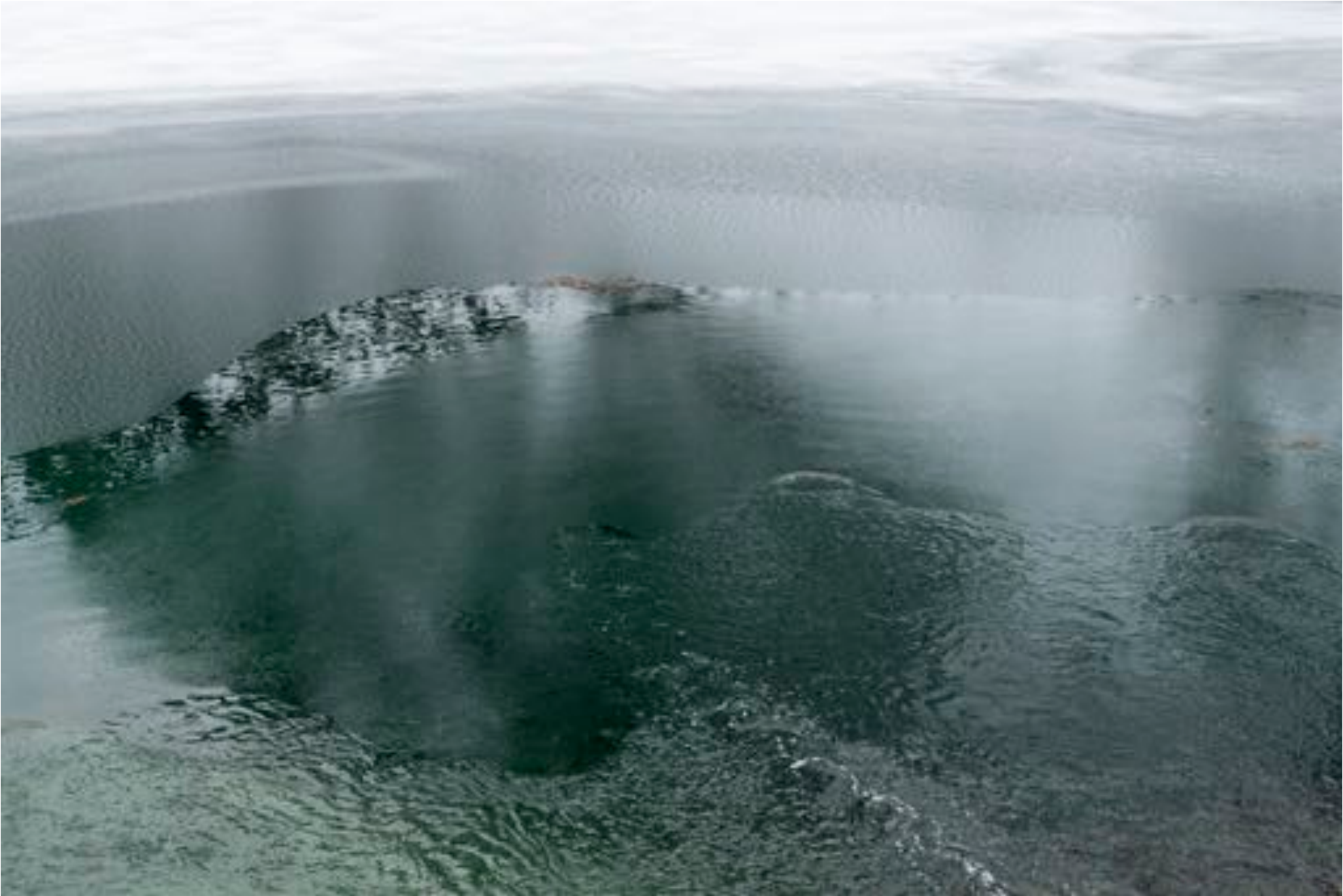
Wonders of nature # 33, (Thaw), 2018