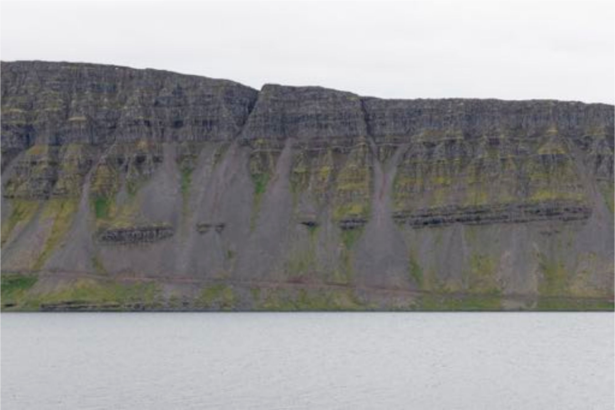
Wonders of nature # 42, 2018