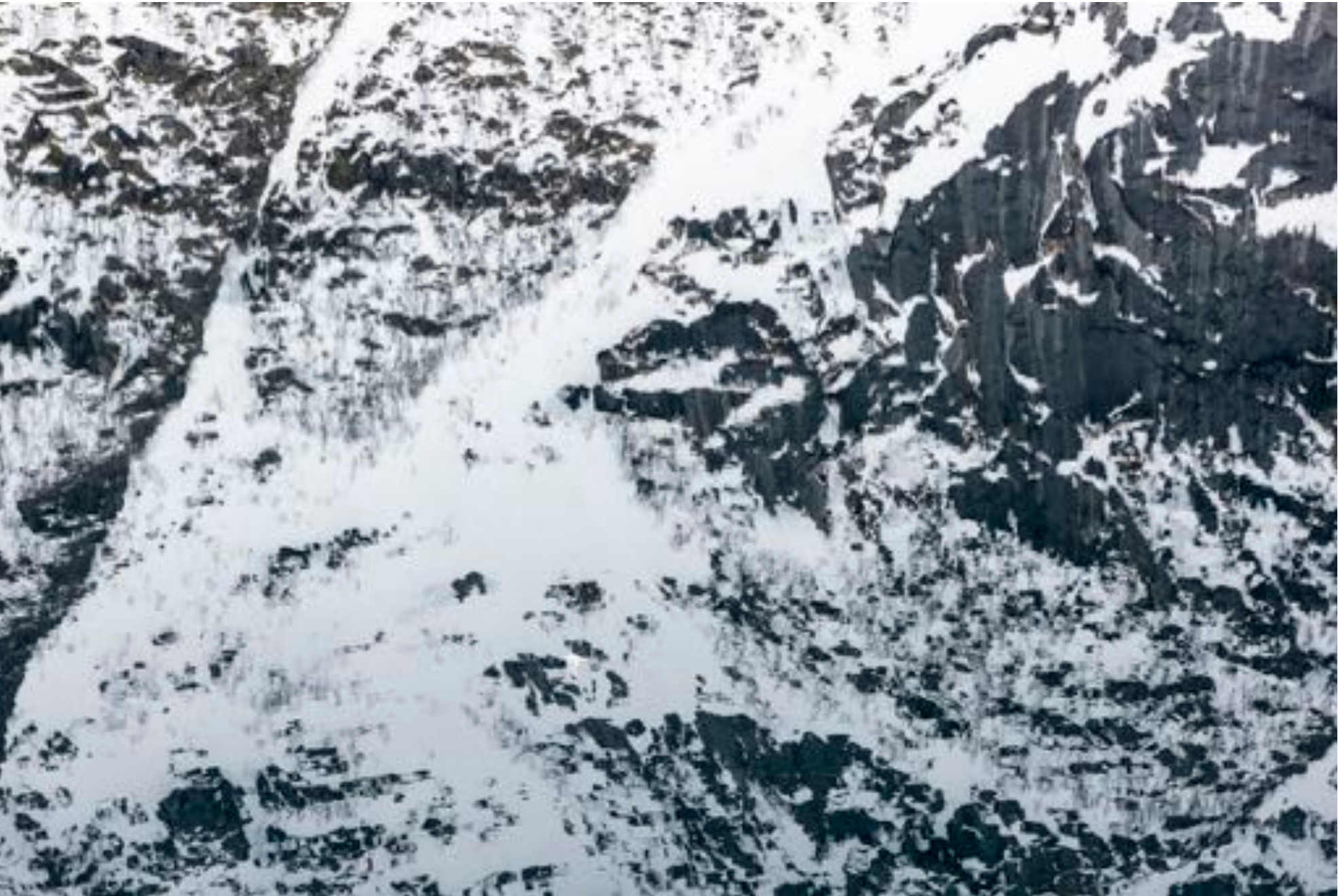
Wonders of nature # 36, (Seagull), 2018