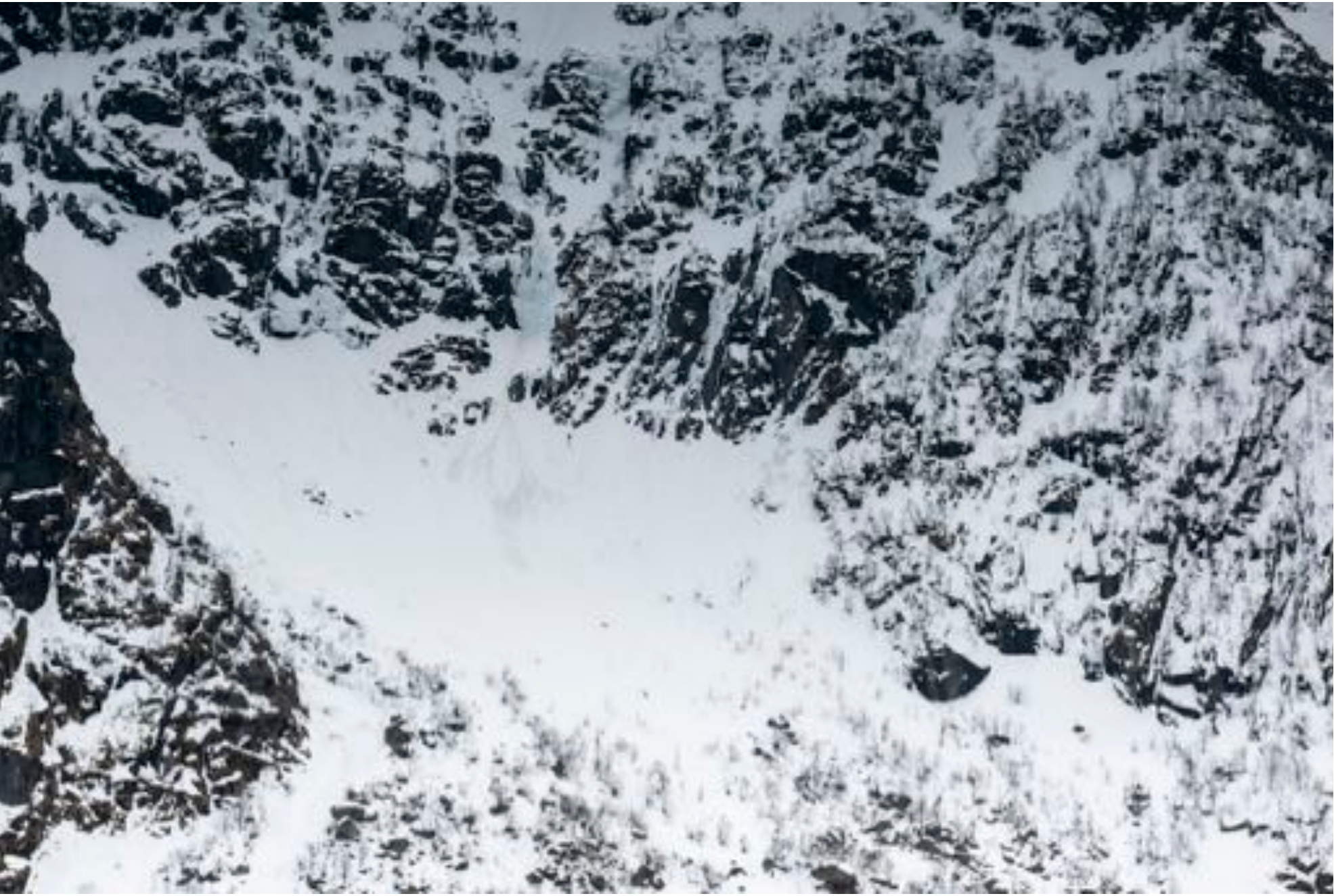
Wonders of nature # 38, 2018