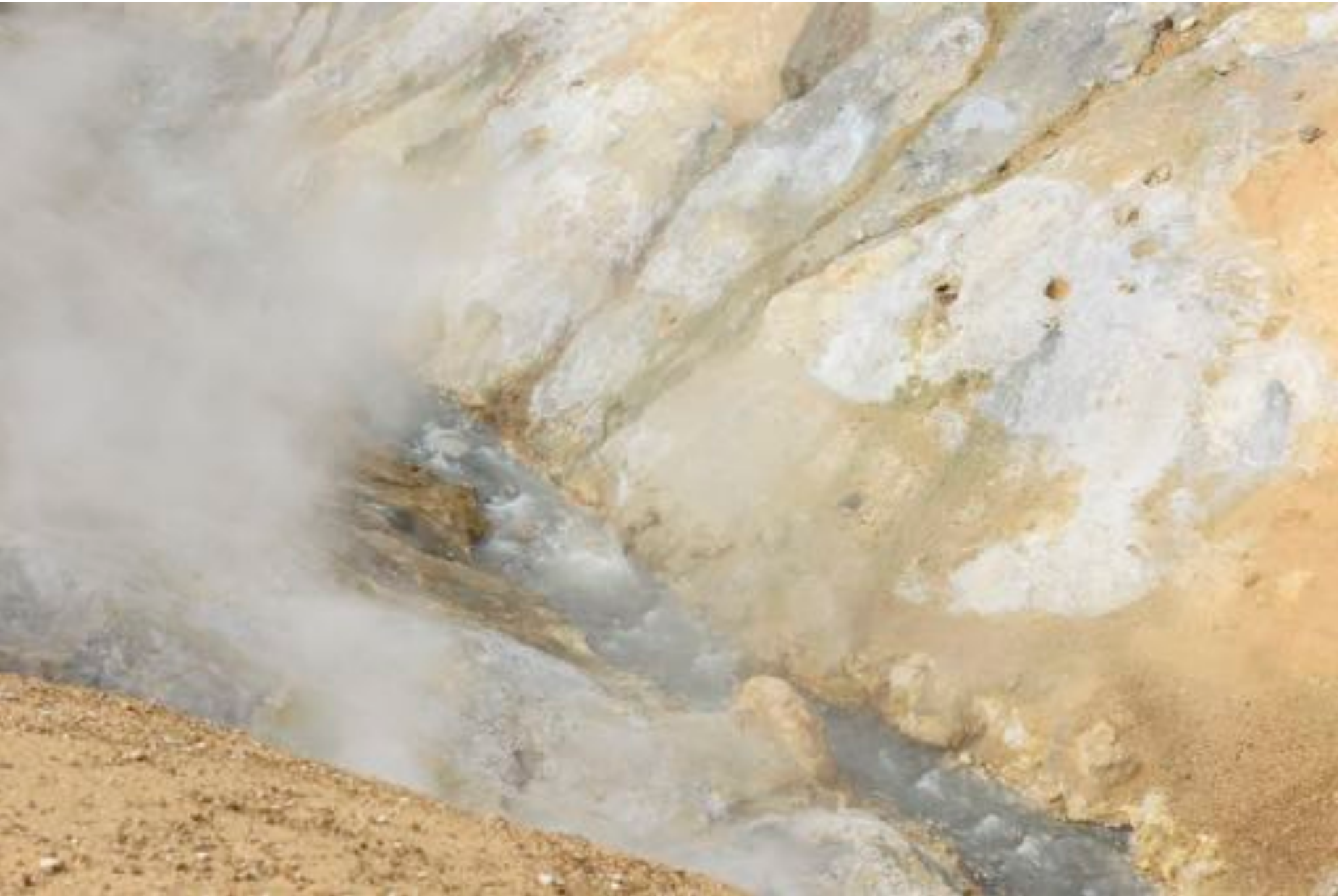
Wonders of nature # 16, 2017