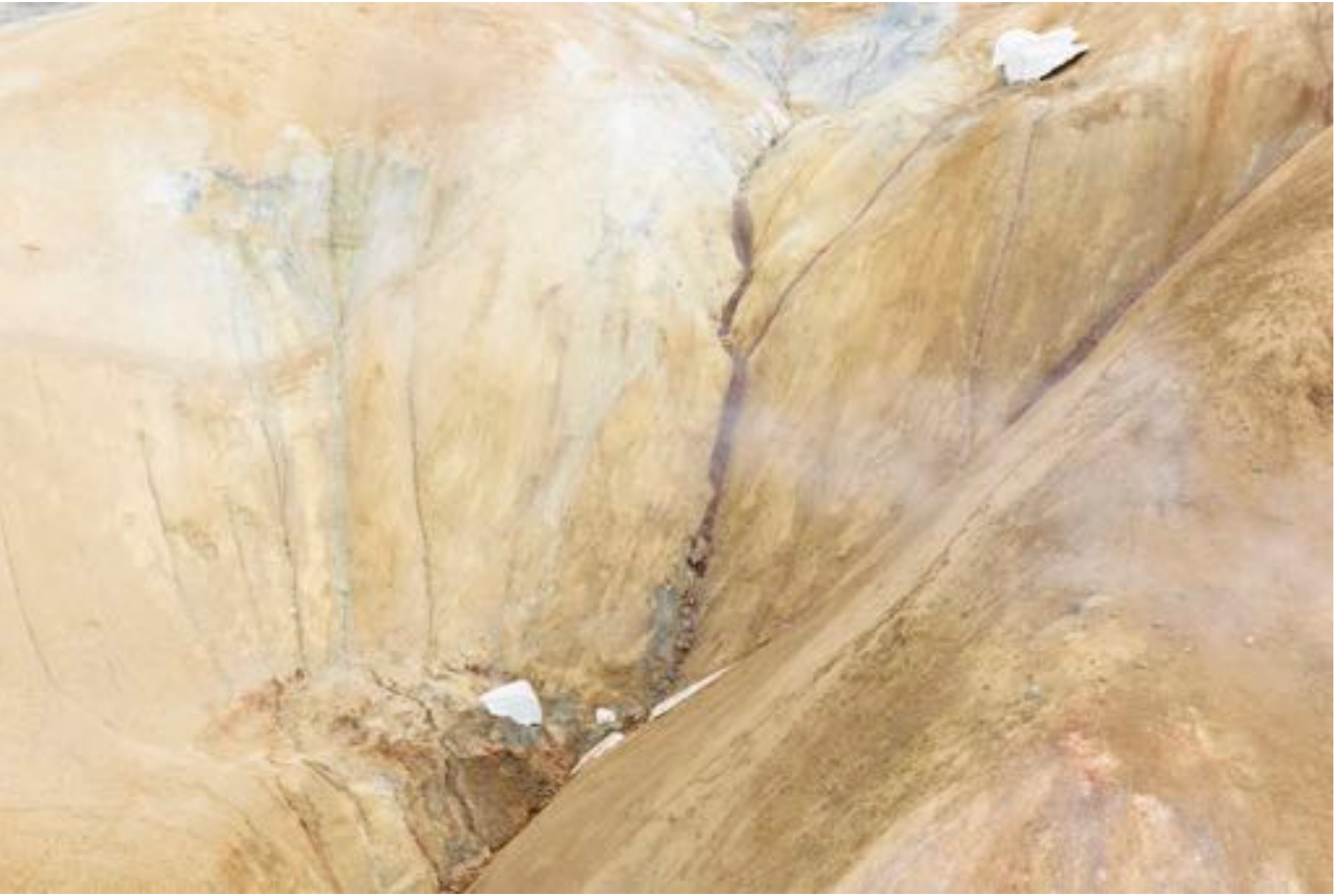
Wonders of nature # 19, (Mother Earth), 2017