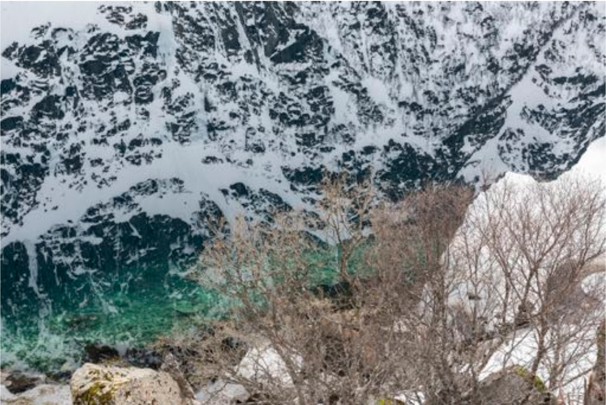
Wonders of nature # 39, 2018