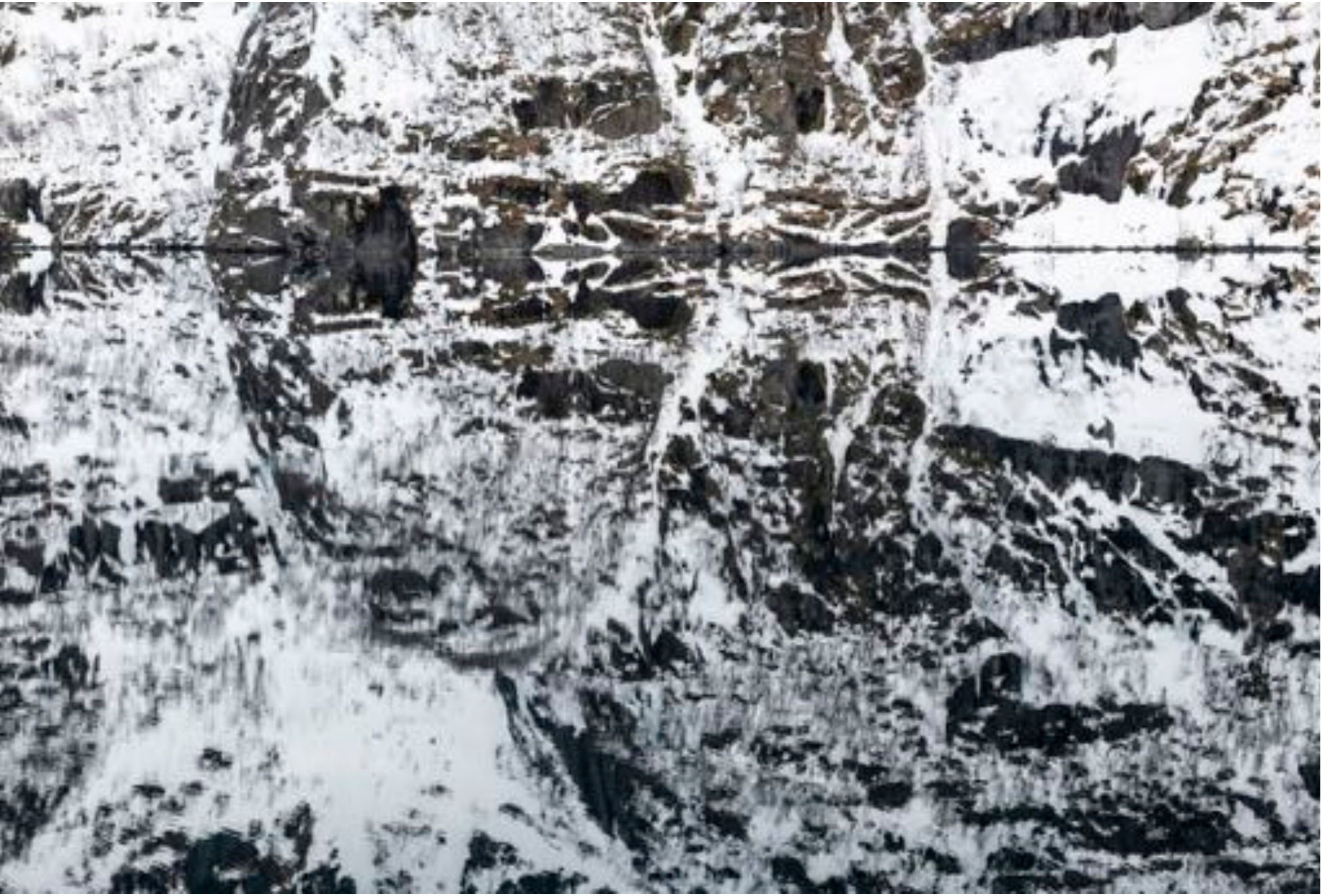
Wonders of nature # 37 (The mask), 2018