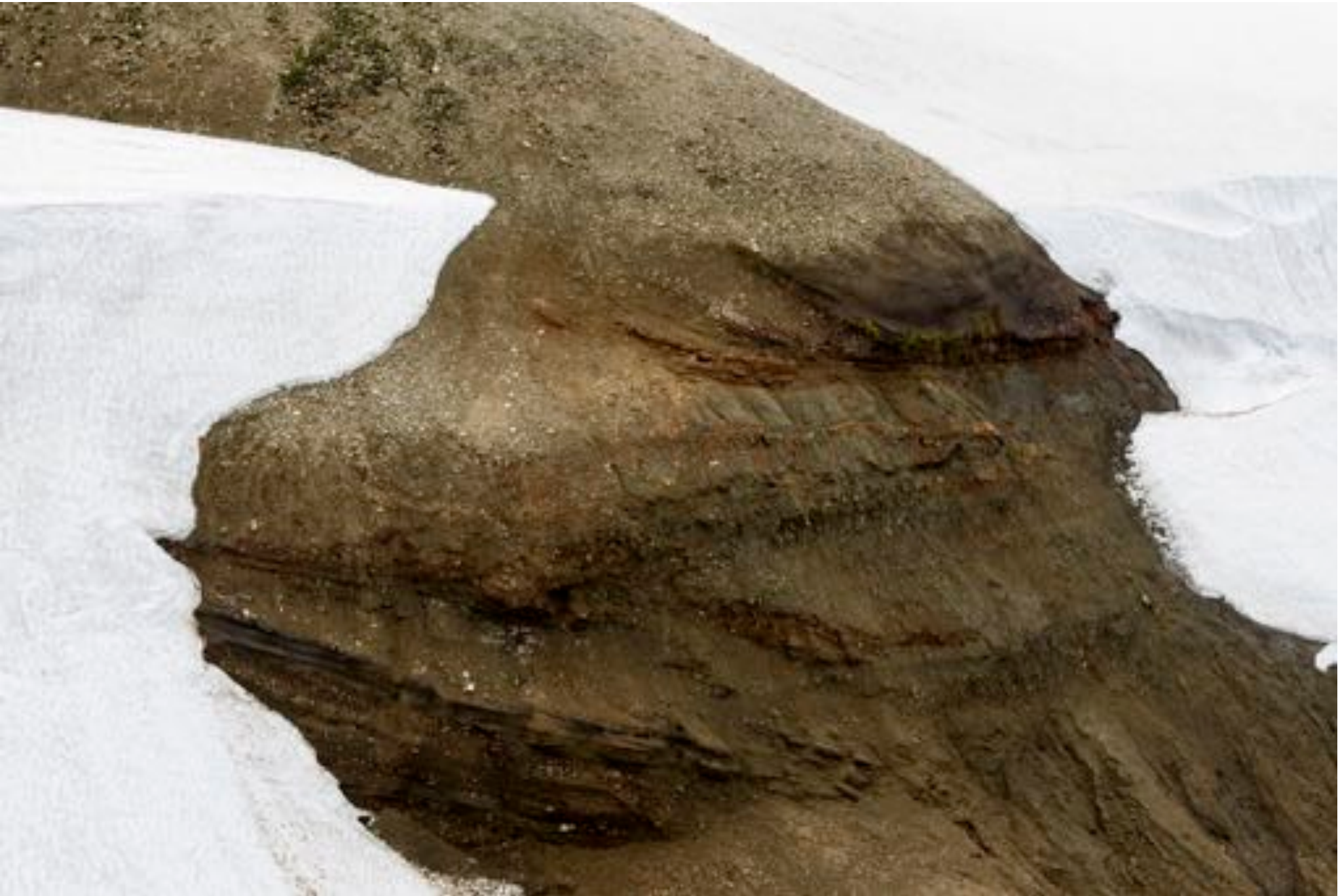
Wonders of nature # 41, 2018