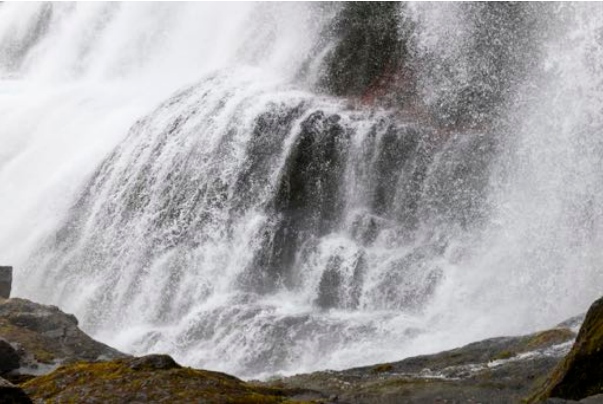
Wonders of nature # 43, 2018