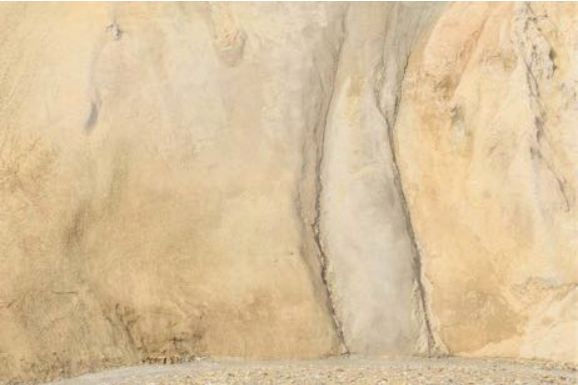
CANO EDHARDT Wonders of Nature #32, 2017