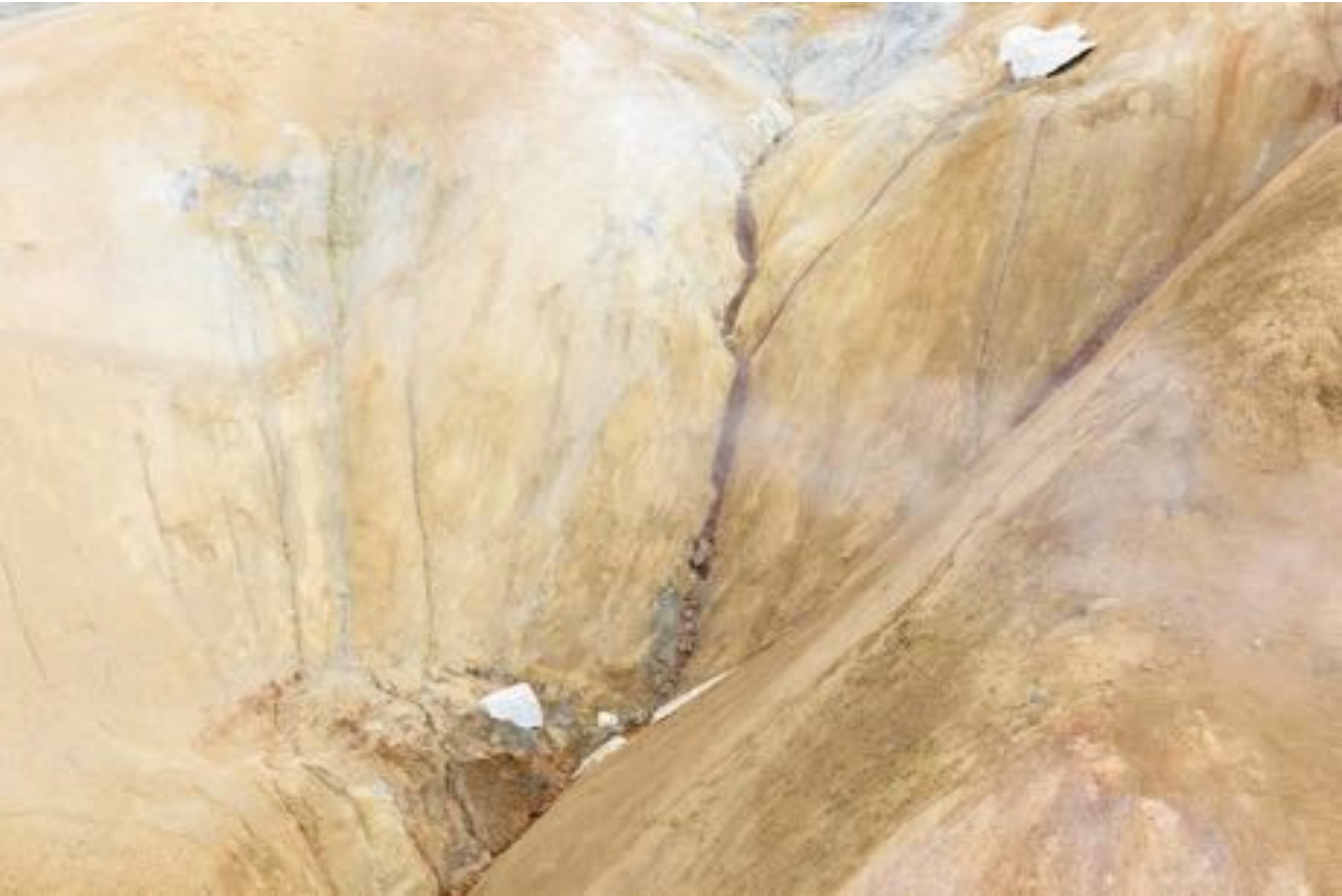
CANO EDHARDT Wonders of Nature #19,2017