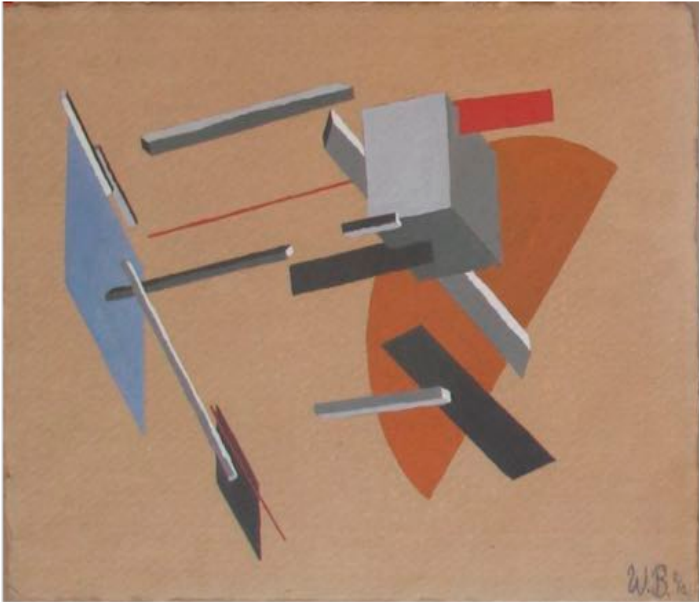
Artista del monograma B.W, 20 x 29 cm, gouache sobre papel