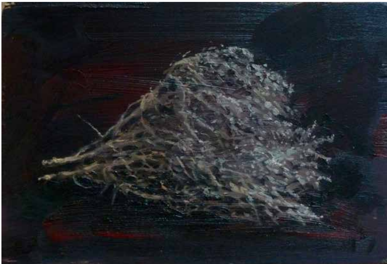
Tomillo 19 x 28 cms Óleo sobre tabla.