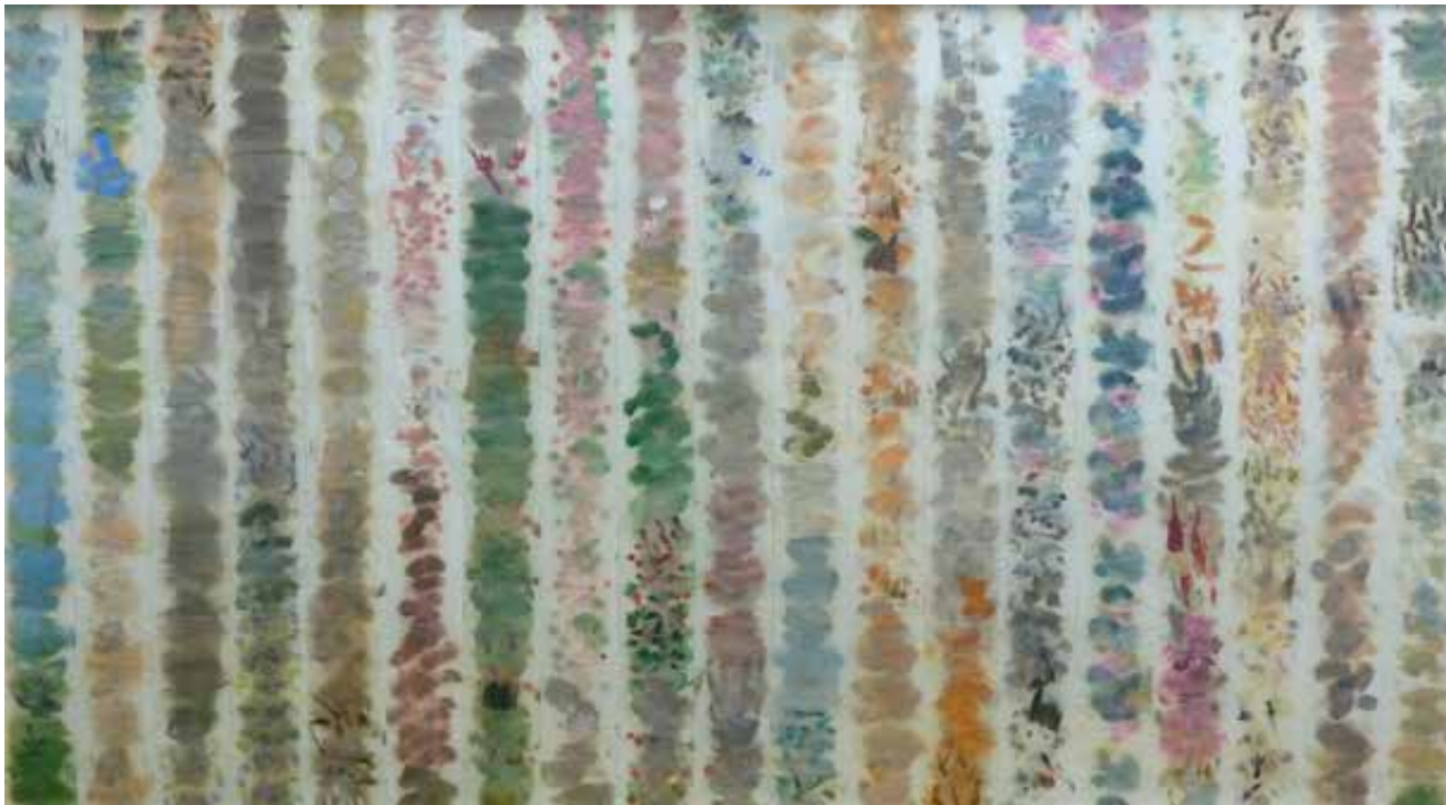
Limpio 4 104 x 184 cms Óleo sobre papel higiénico.