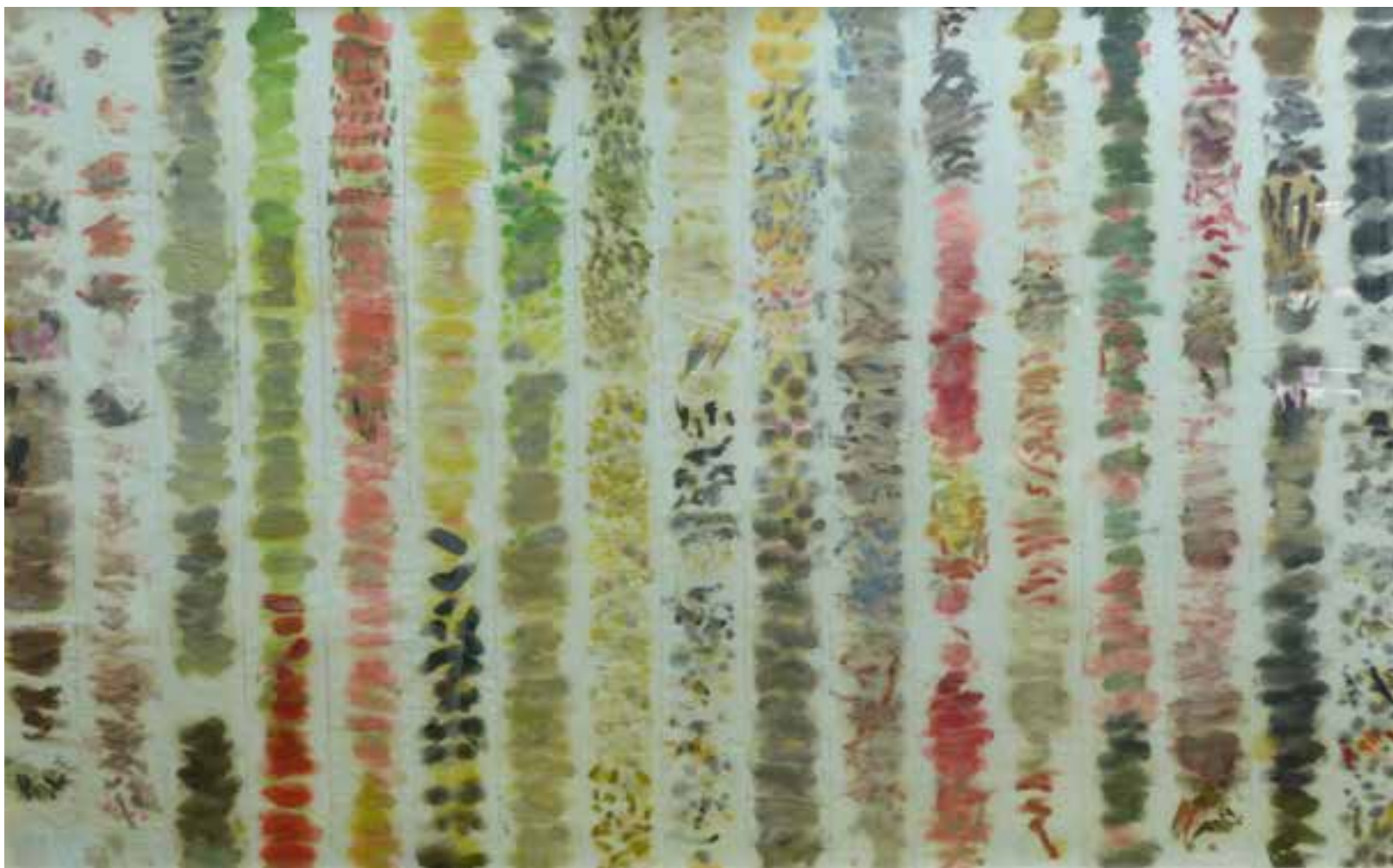
Limpio 1 98 x 104 cms Óleo sobre papel higiênico.