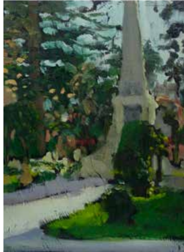
Paperera blava 40 x 50 cms Óleo sobre tabla.