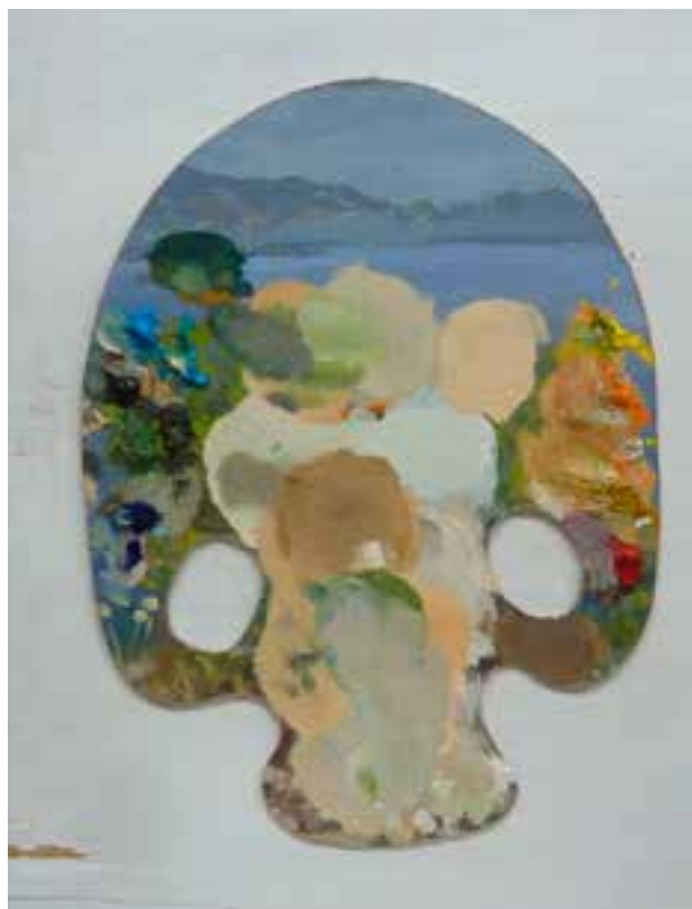
Paleta calavera 40 x 30 cms Óleo sobre tabla entelada.