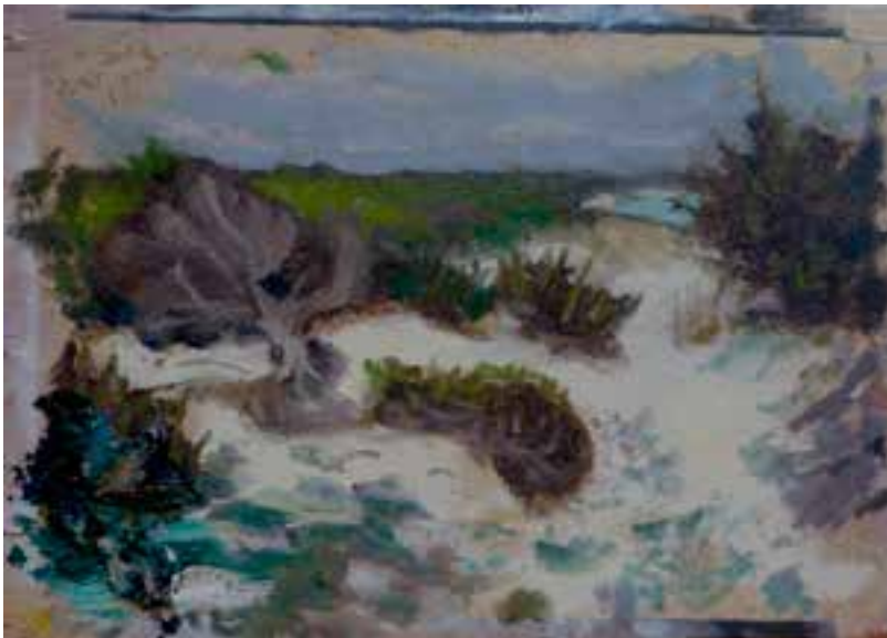
Coll de Bassa 22 x 30 cms Óleo sobre tabla.