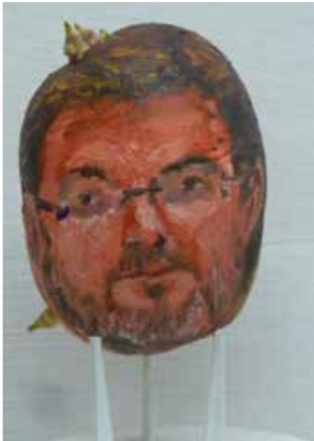
El procés (21 piezas) 15 cms alto x 10 cms ancho (máximo) Óleo sobre patata.