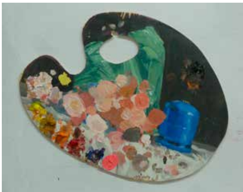
Paleta bolsa y butano 26 x 36 cms Óleo sobre tabla.