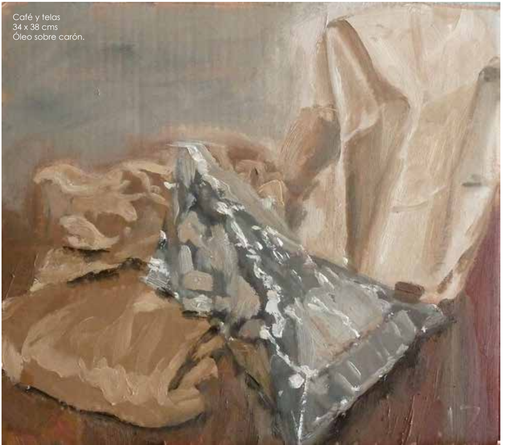
Café y telas 34 x 38 cms Óleo sobre carón.